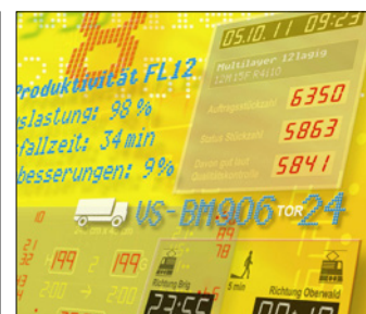
Anzeige- & Informationstechnik