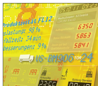
Anzeige- & Informationstechnik