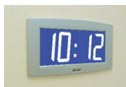
Opalys 14 auf einem Einbauträger

Der NTP Server muss eine Sendezeit (Poll) von unter 128 Sekunden haben.