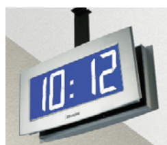
Opalys 14 auf einem doppelseitigen Halter